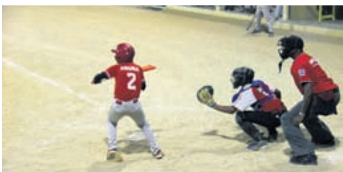
Center League a gana e prome wega den play-off di Little League 2015 junior 13-14. E wega aki a tuma luga na e veld di Pos Chikito. Weganan lo sigui te diadomingo. Les a B2